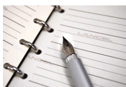
①アンケートにご回答ください