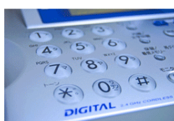
②そのままFAXしてください